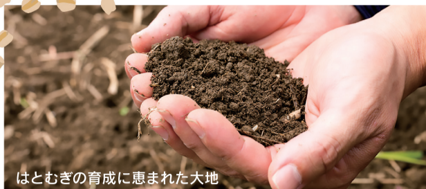
はとむぎの育成に恵まれた大地

小山市では平成3年より2戸の農家から栽培スタートしました。温暖な気候と栽培に適した土壌条件に恵まれ、反収率が高く、粒の大きさと白さが特徴で、希少な国産はとむぎの中でもトップクラスの品質と生産量を誇ります。