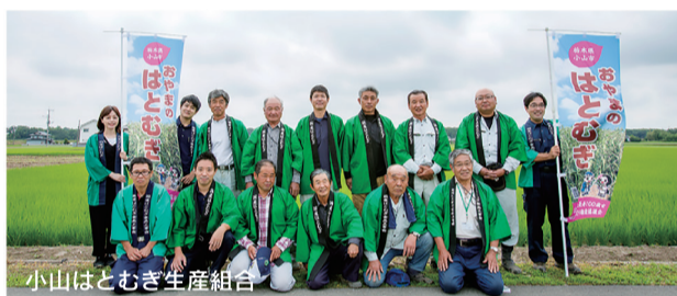
小山はとむぎ生産組合

はとむぎを生活に取り入れ、高齢になっても元気でいきいきと暮らせるまちづくりを目指し、プロジェクトが始動しています。