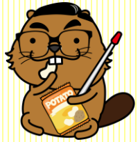
講師：中平 康 中小企業診断士