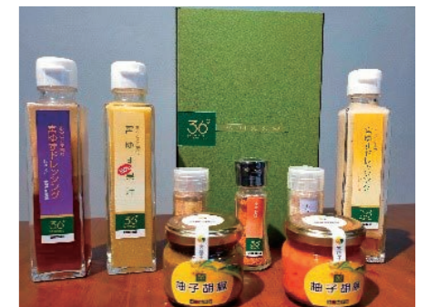
写真：宮柚子ブランド商品

支援内容：新事業による新たな商品の品揃え増加に伴い、登録商標の見直しの必要性をアドバイスし、新事業商品と商品・役務区分に係る支援や、専門家（弁理士）による支援を行いました。さらに、見直しの過程において、事業の多角化に必要とされる商標権を活用した新ブランドの創出支援を行い、新事業商品群に相応しいブランドを創出されるためのお手伝いをしました。