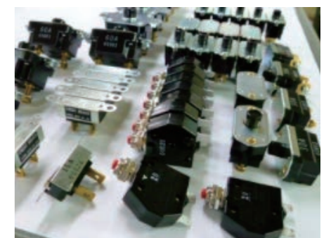
写真：サーキットブレーカー各種

支援内容：当初、製造物の検査方法の特許出願についての相談でしたが、製造方法について特許出願することのメリット、デメリットについて説明し、特許出願については一旦中止することになりました。同社の代表、幹部の方に協力いただき、専門家（INPIT 知的財産戦略アドバイザー）と共に、秘密情報の棚卸、工場、事務所の立ち入り制限、撮影禁止等の表示、秘密情報管理規程の策定等を進め、営業秘密管理体制を整えることが出来、取引先からの信用も向上させることができました。