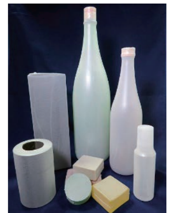
写真：熱収縮フィルム「和 shu」

支援内容：製品の見た目と風合いからネーミングを考え、商品ブランドとして商標登録することを支援しました。さらに、本製品の量産に係る課題について、その解決方法などを含むフィルム製造技術を営業秘密として適切に管理するように支援しました。