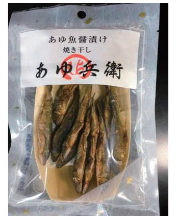
写真：あゆ魚醤油け焼き干し「あゆ兵衛」

支援内容：ハウスネーミング・マーク並びに商品ネーミングの商標取得、取得した商標の活用・ブランド化及び維持管理について支援しました。さらに新商品開発における課題対応、契約締結に係る支援、並びに当該商品及び商品ネーミングに係る第三者への侵害回避及び模倣防止に対して支援しました。