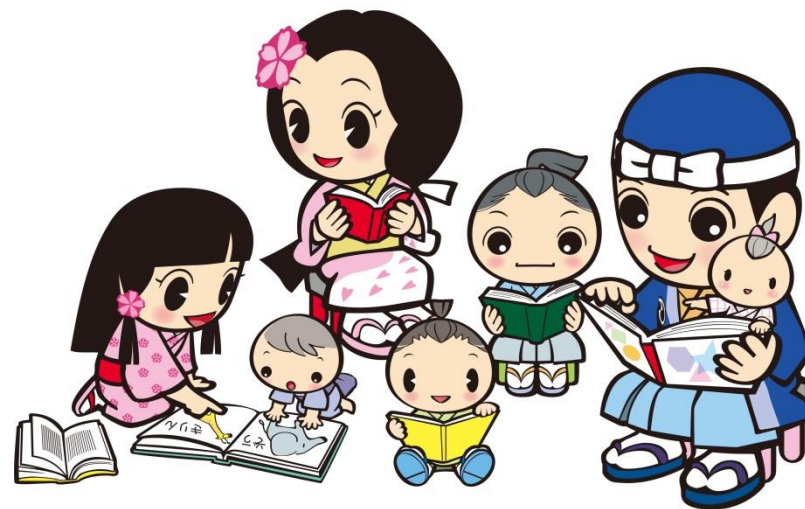
中央図書館マスコットキャラクター